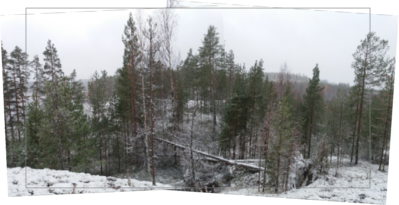
Kuva: Rakennuspaikan suunniteltu uusi sijainti (vaihtoehto 1) kuvattuna kaavaan rajattavan rakennuspaikan pohjoisreunalta etelään.

VE2 - Vaihtoehtoisena sijaintina rakennuspaikan siirrolle kaavan laatija on tarkastellut tilalla nykyisten RA-alueiden välistä aluetta jossa on hiekkarantainen, loivasti kaartuva poukama. Maastokäynnillä todettiin, että ranta on hyvin matala. Maasto on alueella suhteellisen alavaa, eikä siten ole erityisen suositeltava rakentamiseen. Takamaastossa todettiin vastaavilla korkeuksilla ojitettujen alueiden lisäksi maastonkohtia, joissa vesi oli jäänyt uomiin seisomaan. Alueelle ei tulisi toteuttaa rakentamista.