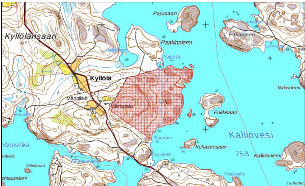
Kuva: Ote peruskartasta, jossa kiinteistöjen rajat on esitetty punaisella viivalla (MML 12/2019). Punaisella rasterilla on esitetty kiinteistöön kuuluvat palsta-alueet.

Alueella on yksityinen maanomistaja. Kuvassa on esitetty kiinteistöön 623-418-1-129 kuuluvat palsta-alueet punaisella rasterilla. Lohkottu rakennuspaikka 623-418-1-128 rajautuu suunnittelualueeseen ja on eri maanomistajan omistuksessa.