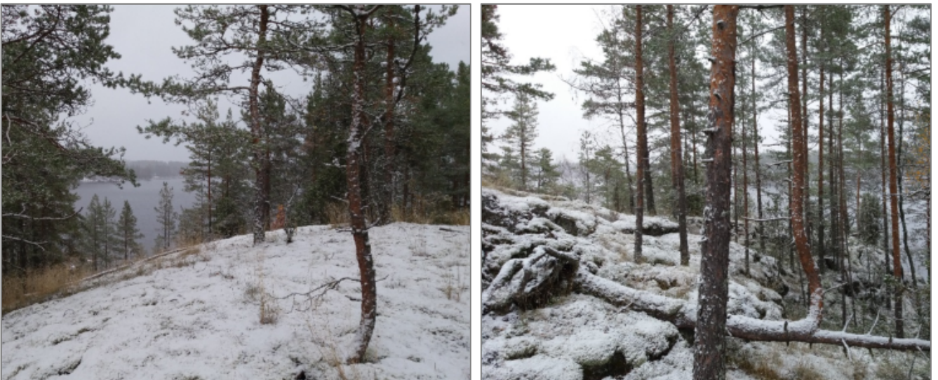
Kuvat yllä: Tilan pohjoisrannan kallioniemeä kuvattuna laelta koilliseen. Alue säilyy kaavassa ennallaan. Alueelle kohdistuu kaavan ohjeellinen viivamerkintä ma, maisemallisesti arvokas alue.

Suunniteltu rakennuspaikka (VE1) sijaitsee näiden maisemallisesti arvokkaiden kallioiden eteläpuolella, rajautuen lohkotilaan 1-128, jossa on kaavassa lomarakennuspaikka. Rakennuspaikat rajoittuvat rantaan niemen itäpuolella. Suunnitellun rakennuspaikan takareunalla on kalliotasanne, muutoin rakennusalue sijoittuu kumpuilevan kallioalueen väliseen maastoon. Lomarakennukset on lähtökohtaisesti tarkoitus sijoittaa painanteeseen kallioiden väliin, paikkaan jossa on rannassa pieni poukama. Nykyisellä puustolla paikka ei ole liian varjoisa, ja jyrkkyydeltään rinne soveltuu rakentamiseen. Eteläpuolella viereinen rakennuspaikka (RA) sijaitsee korkeahkon laakean kallion takana. Rakentaminen maisemallisesti arvokkaalla alueella sijoittuu maaston suojaisiin kohtiin.