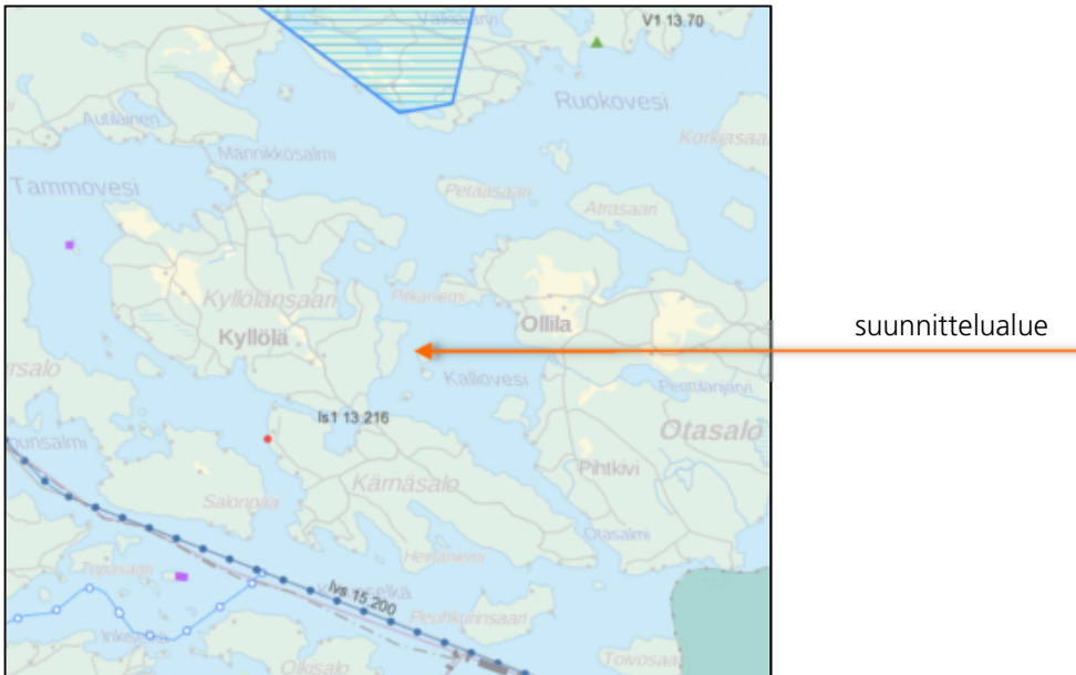
Kuva: Ote Etelä-Savon maakuntakaavojen yhdistelmästä (2016). Nuoli osoittaa alueen sijainnin.