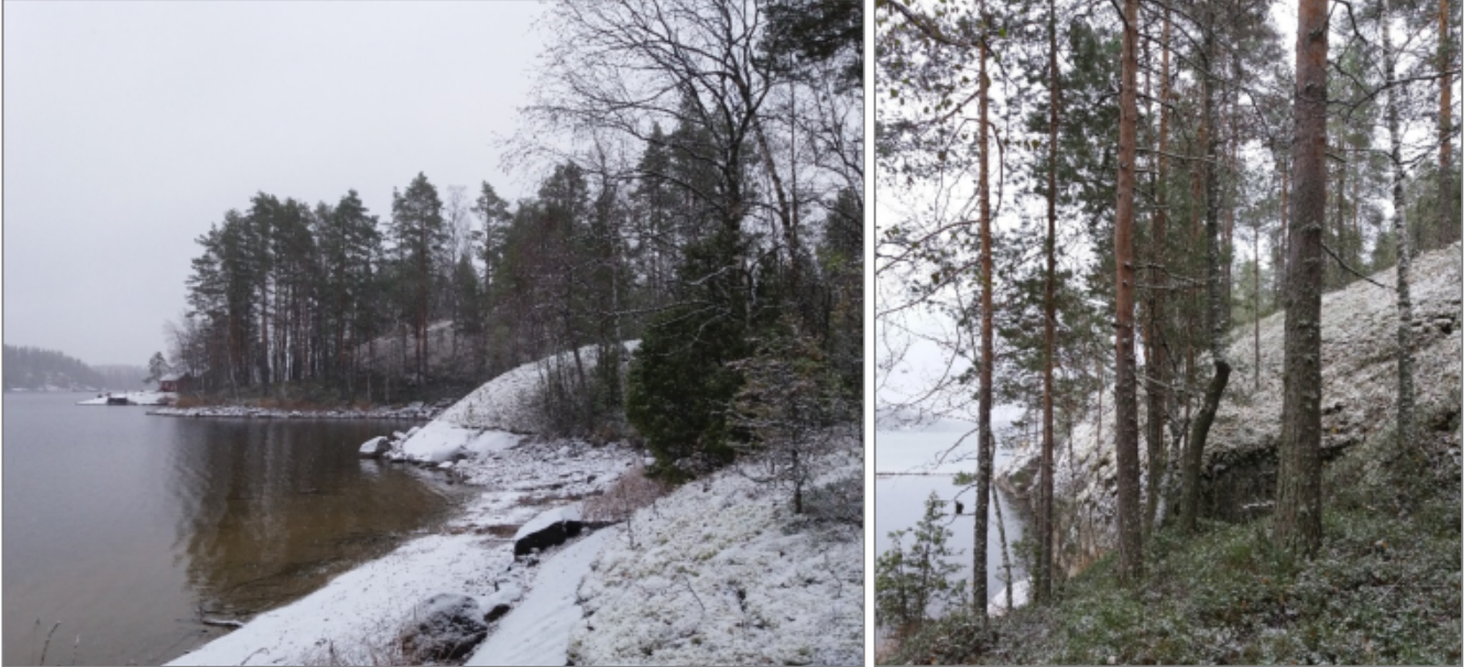
Kuvat yllä: Tilan pohjoisrannan maisemallisesti arvokkaat kalliot. Taustalla vasemmalla tilaan kuuluva saari, jossa on rakentunut sauna (RA-6).

vie pitkospuut saareen, jossa sijaitsee saunarakennus (RA-6). Saunasaaren eteläpuolella on suunnittelualueen korkein kallioalue, jonka sammalpeitteiseltä laelta on näkymät kaikkiin ilmansuuntiin.