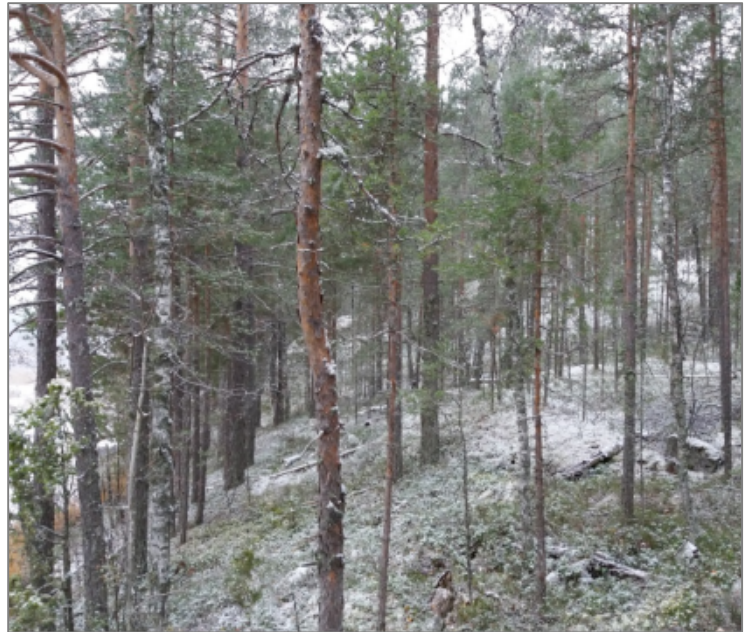
Kuvat yllä: Kaavassa nykyisen 2 RA – korttelin pohjoisempi rakennuspaikka, johon ei kohdistu tässä tarkastelussa muutosta. Muutoksen jälkeen rakennuspaikka on noin 7000 m 2 suuruinen.